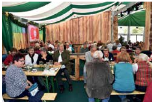
7. Oktober - Kaiserwiese in Wien