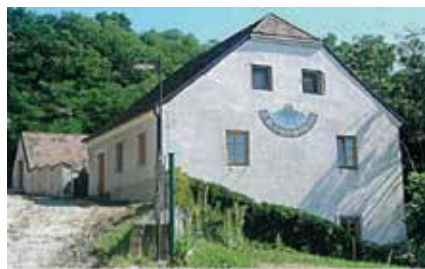
Kranzmühle in Leodagger