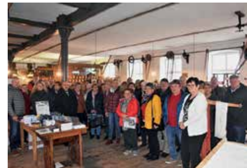
13. November - Ganslessen