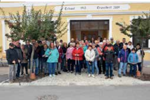
4. Oktober - Herbstwandern