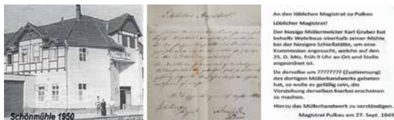
27. Sept. 1849 - Brief vom Magistrat Eggenburg an den Magistrat Pulkau um Kommission zur Wehrbau für die Mühle (heute Schönmühle).