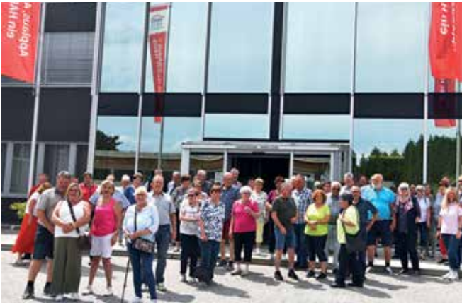
5. Juni - Tagesausflug ins Waldviertel