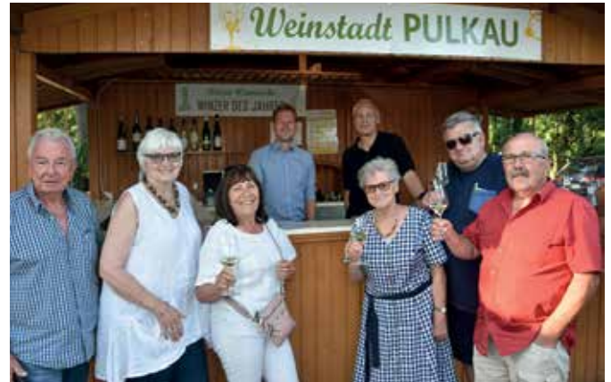
20. Juni - Besuch der Retzer Weintage